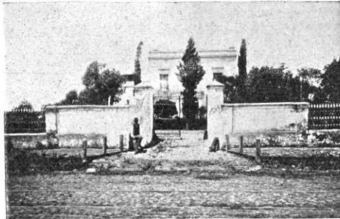
CASA DEL ALMIRANTE BROWN EN BARRACAS