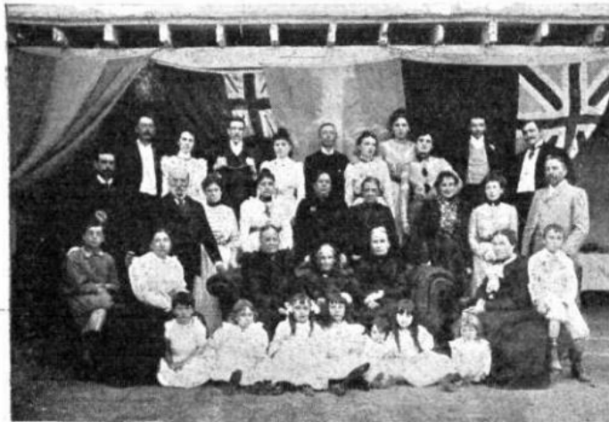
FAMILIA QUE ACTUALMENTE OCUPA LA CASA DE BROWN