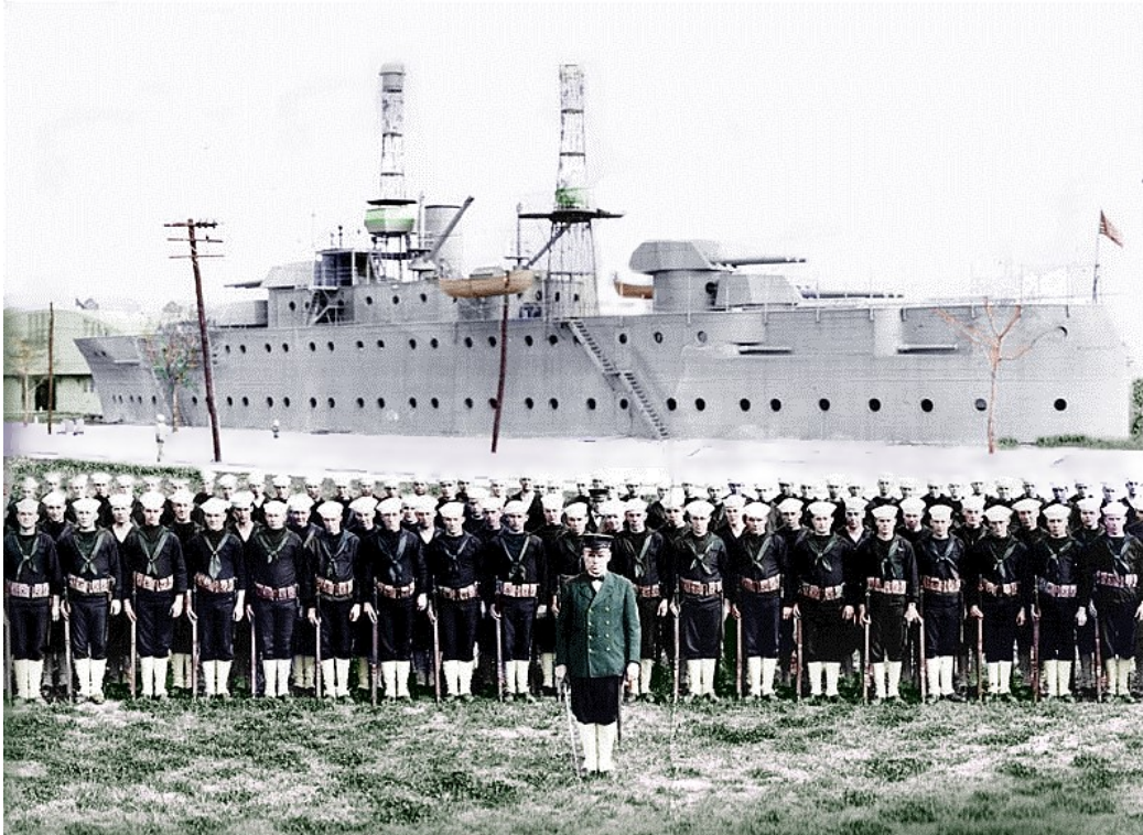
Buque en tierra, escala 1: 0.75, escuela de electricistas, 1925