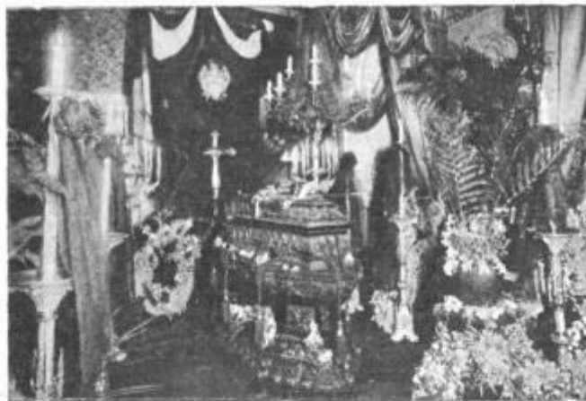
La capilla ardiente

En 1880, cuando comenzó á formarse la escuadra actual, fué el vicealmirante Cordero quien presidió la formación del primer núcleo, adquiriendo los primeros barcos que vinieron al país, y pocos son los jefes actuales que no hayan sido sus subalternos. La labor de ese período en que todo estaba por hacerse en nuestra marina, fué