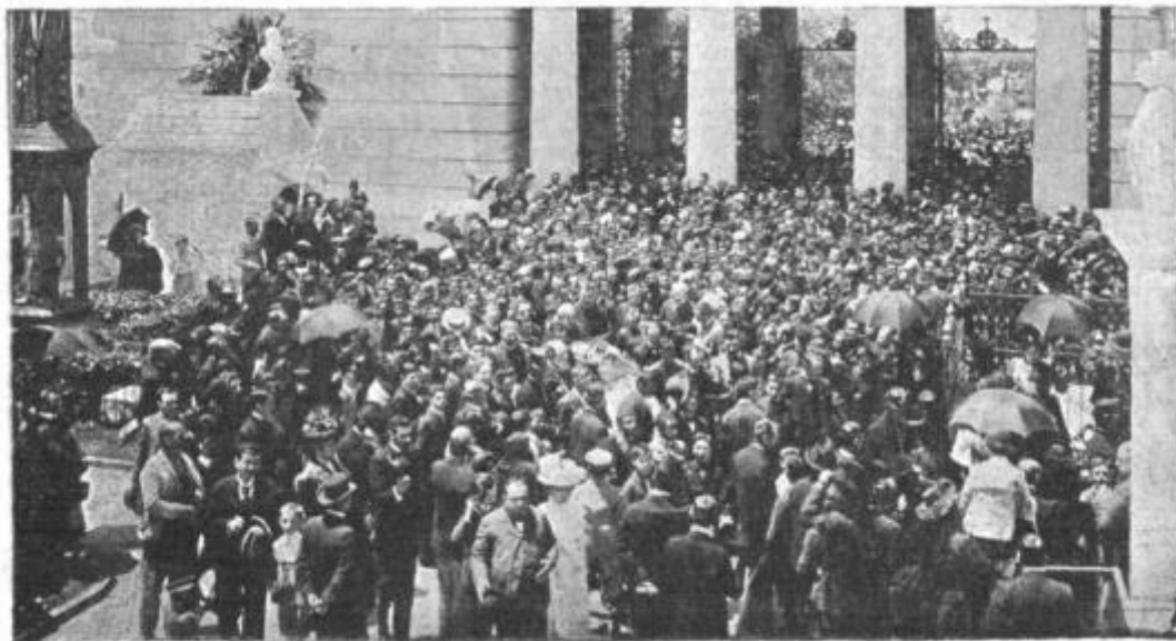
El cortejo fúnebre en el cementerio de la Recoleta