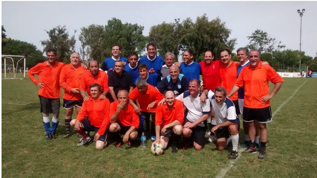
Promoción 30 LMGSM, de destacada actuación, en difícil partido con Selección Mayores 50 del CGLNM.