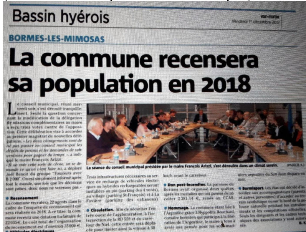
Publicación diario Var Matin 01/12/2017