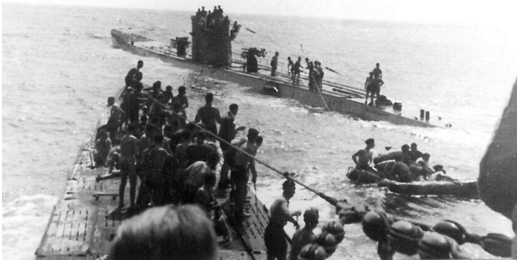
U-156 y T-506 con naufragos del Laconia

El acontecimiento cambió la actitud general del personal naval de Alemania hacia el rescate de los marineros aliados. Los mandos de la Kriegsmarine prohibieron específicamente cualquier intento de este tipo, lo que ayuda a marcar el comienzo de la guerra submarina sin restricciones para el resto de la guerra. Ni los pilotos de Estados Unidos ni su comandante fueron castigados o investigados, y la cuestión fue dejada de lado por el Ejército de Estados Unidos.