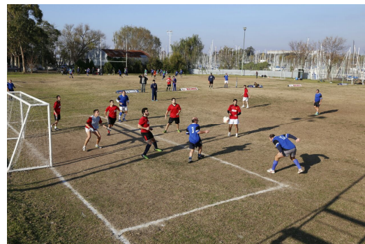
Un par de instantáneas del equipo representativo de las promociones 2X –decano del campeonato– el 18/07/2015 en el Centro.