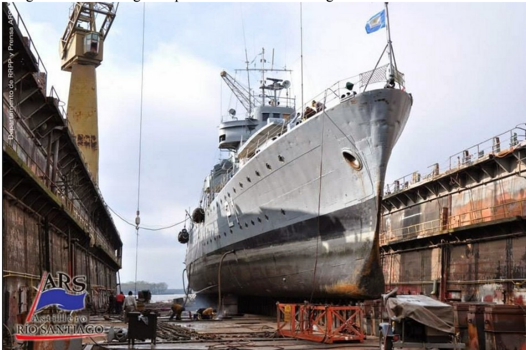
Imagen del ARA King en reparaciones en Río Santiago.