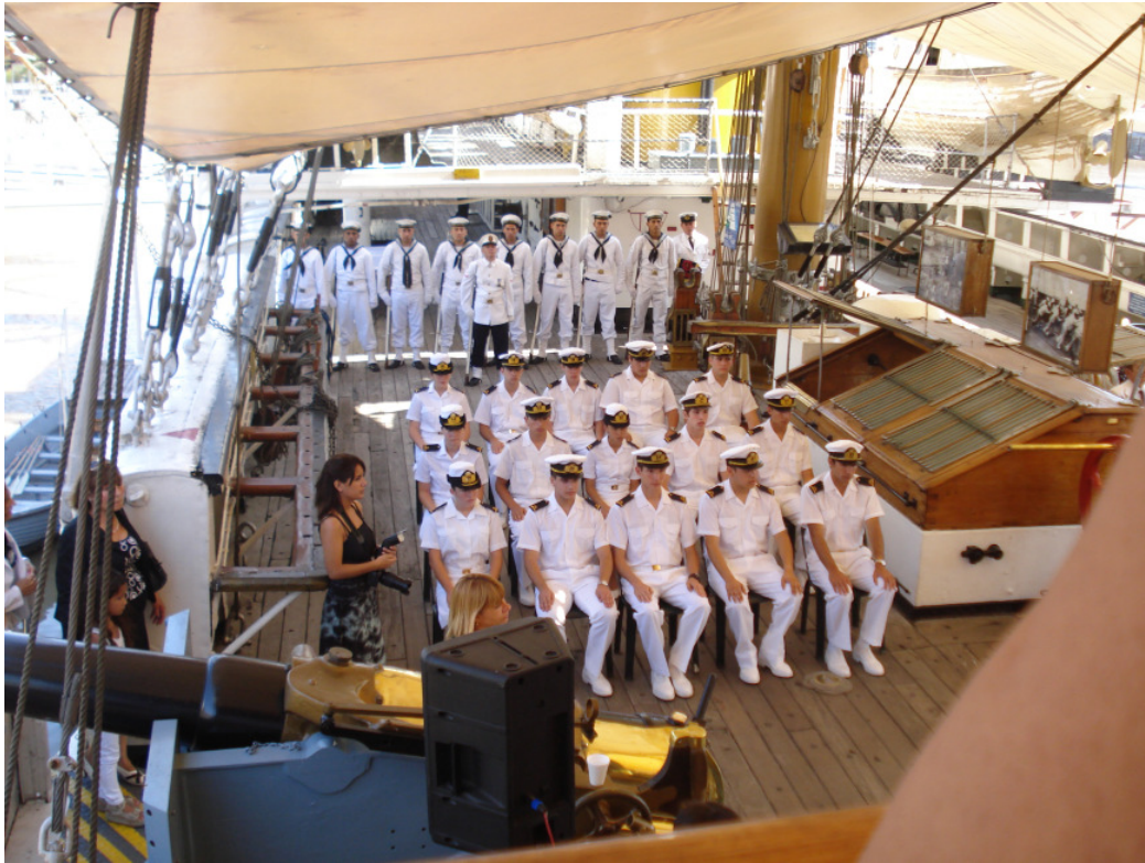
Los guardiamarinas de la promoción LVIII.