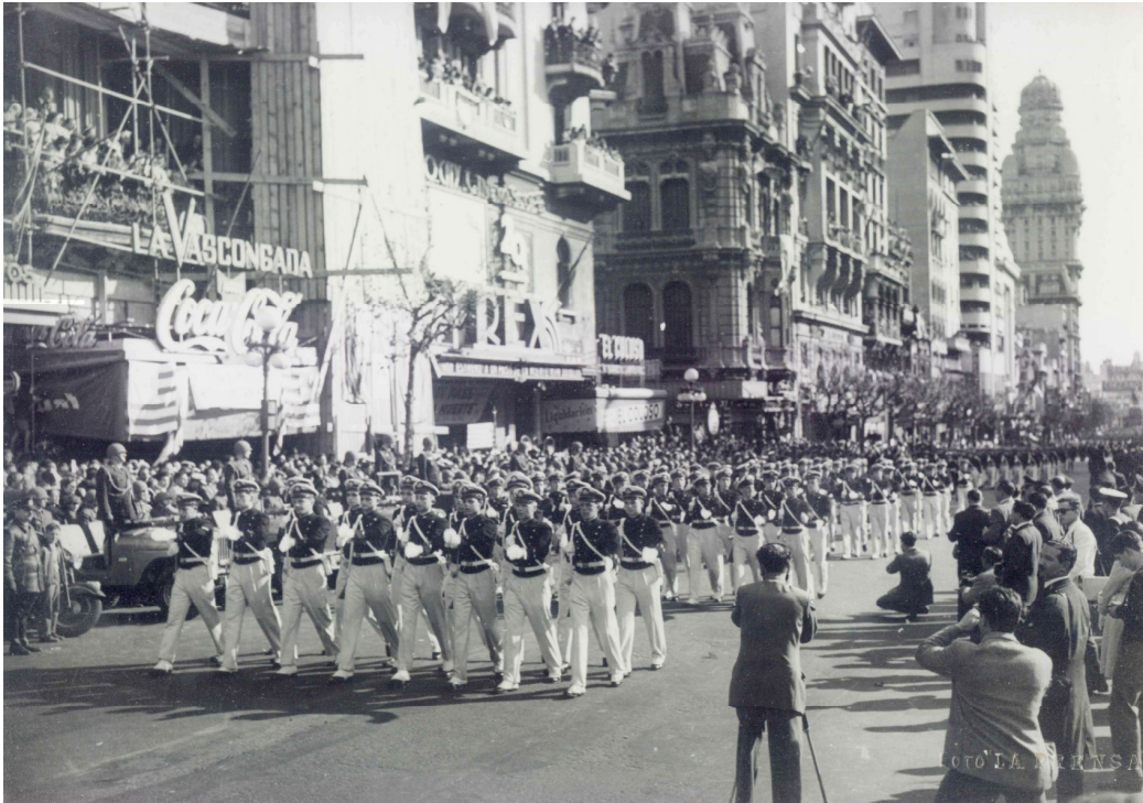
Un desfile por la avenida 18 de Julio de Montevideo el 25 de agosto de 1956, única oportunidad en nuestra época en que rendimos honores haciendo "Vista Izquierda".