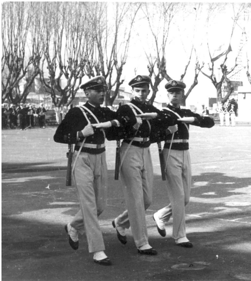
Desfile de los que acababan de jurar la bandera, rindiéndole honores pasaban de a tres, VIIIª promoción, año 1957.