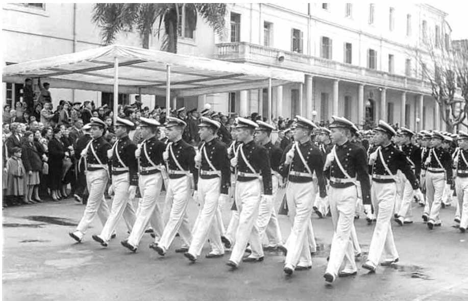
Un desfile en la Plaza de Armas del viejo Liceo año 1956.

Acá van tres fotos con cadetes del Liceo vistiendo el viejo uniforme de desfile con polainas y tirapiés incluidos (no sé si se usan todavía):