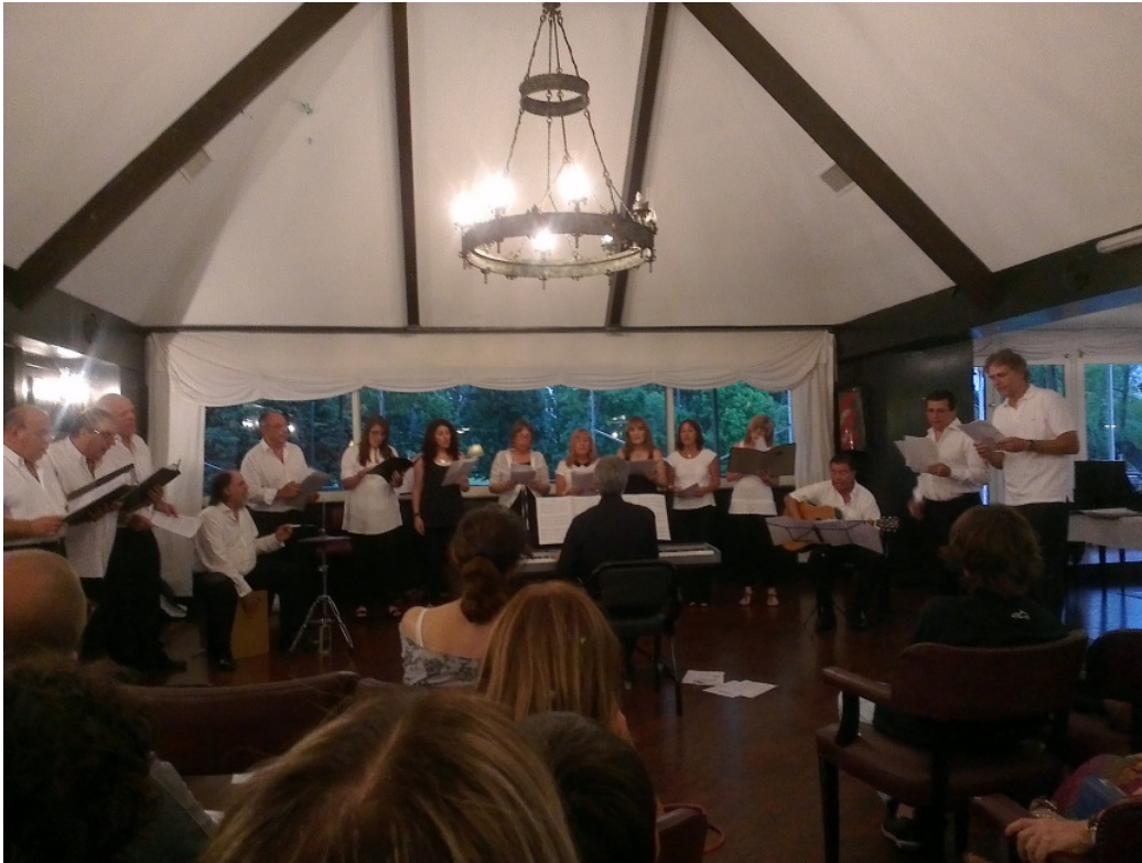
El Coro del Centro durante su actuación.